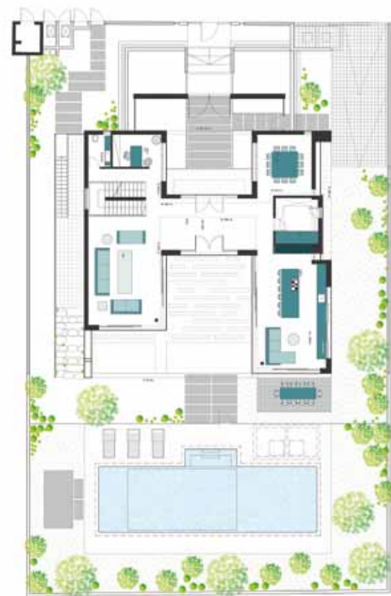
תוכנית קומת הקרקע

דלת עץ גדולה סבה על ציר מרכזי ומובילה אל מבואה חיצונית