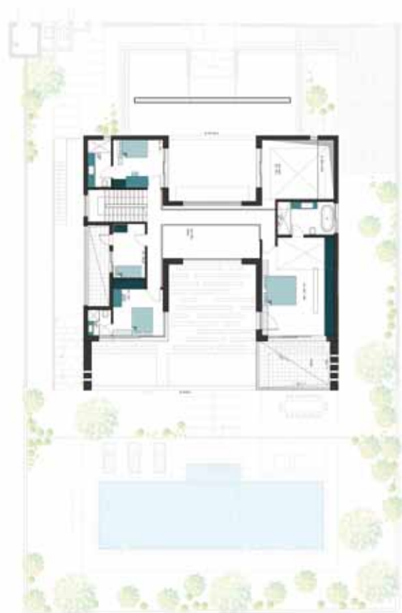
תוכנית הקומה הראשונה