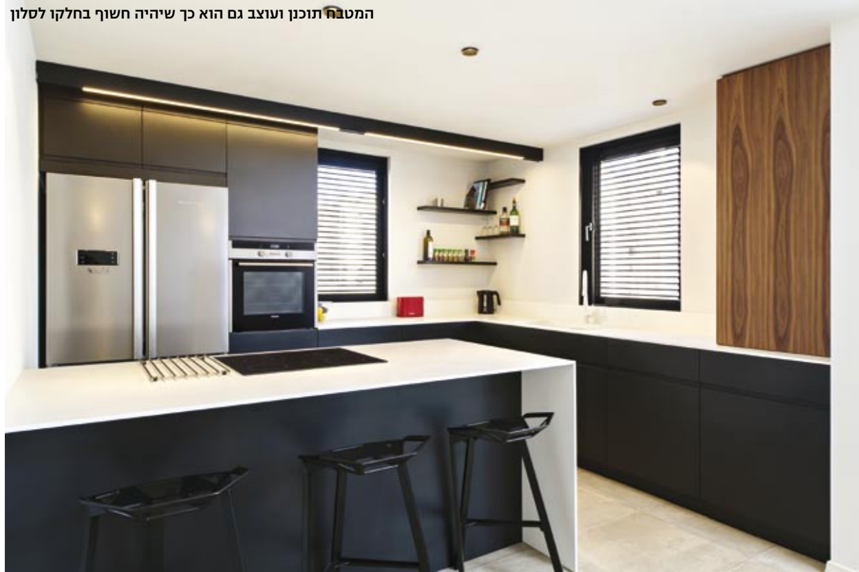
המטבח תוכנן ועוצב גם הוא כך שיהיה חשוף בחלקו לסלון